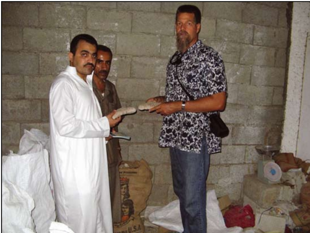
Photo 2. The authors with a merchant in a dried sea cucumber store, Al Hudaydah.

The Red Sea due to its extensive coastline, offshore islands and reef systems provides the largest marine habitat for sea cucumbers within Yemen's territorial waters and subsequently has supported a profitable sea cucumber fishery in the past. Sea cucumbers within the Red Sea in general are collected and processed directly by the fishers or fish societies and traded directly to the merchants. These merchants store the dried species either in the yards of their houses or in small stores (Photo 2).