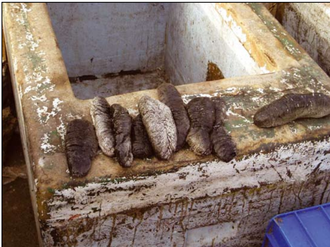
Photo 3. By-product sand fish ( H. scabra ) recently landed at the Salif fish market, Al Hudaydah.

Although sea cucumbers are harvested as a by-product (Photo 3) of the shrimp trawl fishery, this fishery is the second largest harvest fishery for sea cucumbers in the country. It is expected that the larger domestic trawl fleets and those of neighbouring countries (e.g., Egyptian cat fish trawlers) also collect sea cucumbers as a by-product of their fishing activities. However data on these activities are not available.