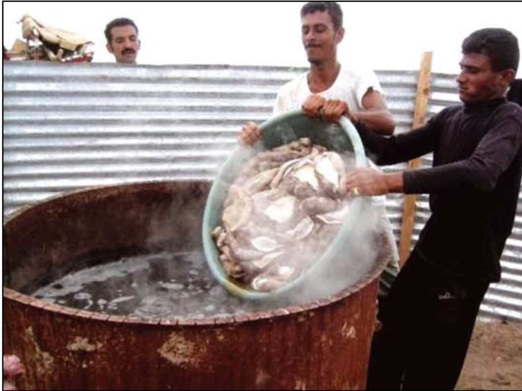
Photo 1. Fishers on Dhuhirab Island (northern reefs of the Red Sea) processing sea cucumbers in 2004.