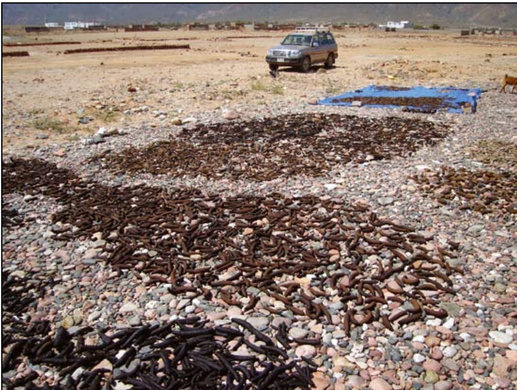
Photo 5. Commercial sea cucumbers processed on Socotra Island in 2006.

The coastline of the Socotra Archipelago, the offshore islands and reef systems provide relatively large areas of marine habitat suitable for sea cucumbers and it has supported a profitable sea cucumber fishery for several years. However, the collection of sea cucumbers within the archipelago was undertaken for many years at a very low level as a direct response to outside merchants' requests. Only more recently has the industry developed (Photo 5) as sea cucumber stock populations within Yemen and neighbouring countries have become depleted and fishers and merchants moved their operations to areas where stocks still remain.