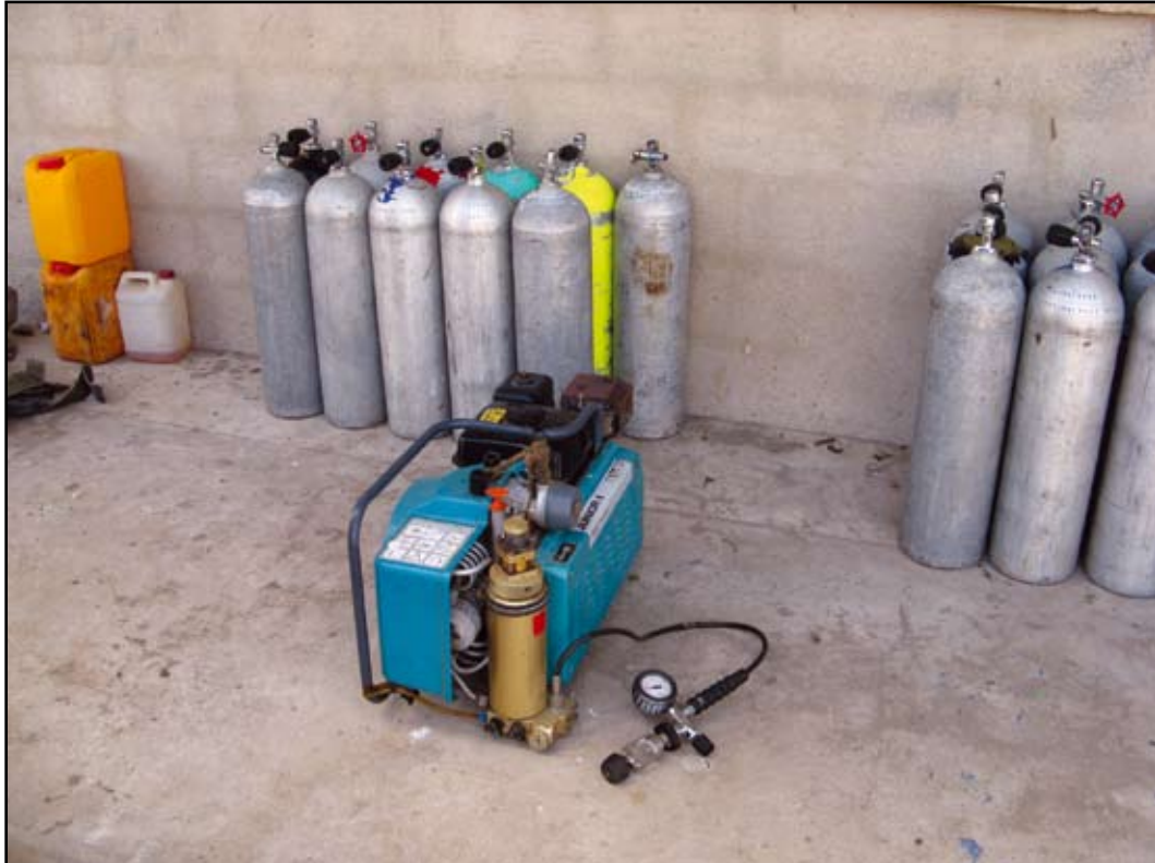
Photo 4. SCUBA equipment used for sea cucumber collection in Foqum, Aden.

It was reported that sea cucumbers are collected from depths to 50 metres and a number of fatalities and permanent disabilities have occurred as a direct result of compressed air diving. Most sea cucumbers are harvested seasonally within the Gulf of Aden during the calmer summer period. However, the larger commercial operations were reported to fish year-round.