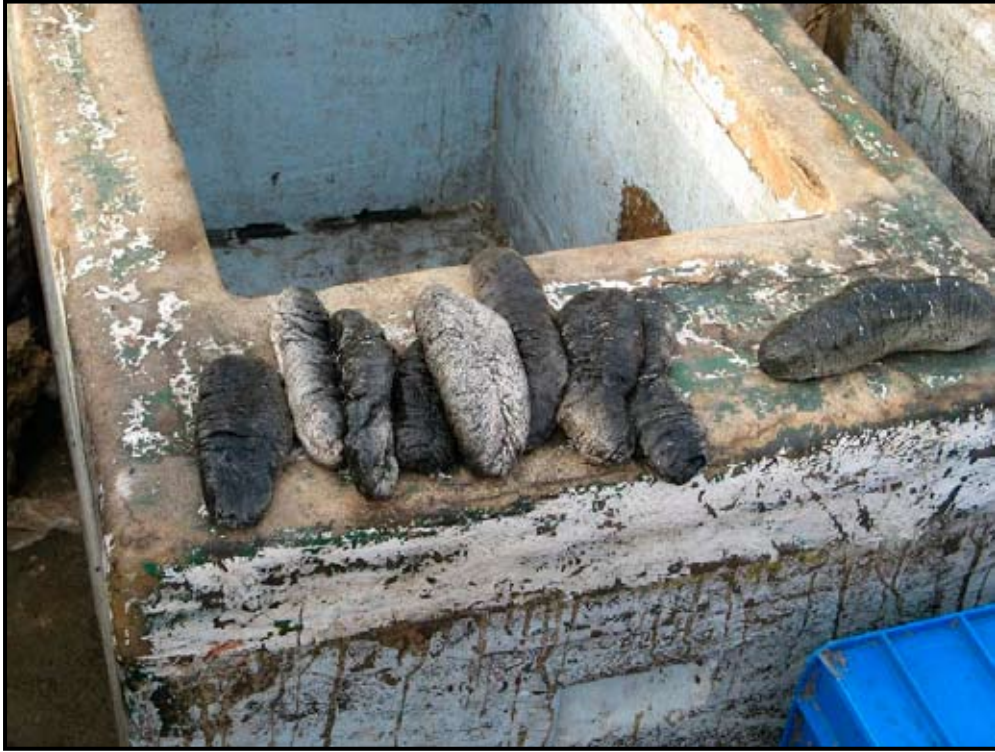
الصورة (3) خيار البحر من نوع أبيض كمنتج ثانوي تم إنزاله مؤخراً في سوق الأسماك في مدينة الصليف، الحديدة.

على الرغم من حصاد خيار البحر كمنتج ثانوي (أنظر الصورة 3) في مصائد الروبيان بشبناك الجر القاعي، تعتبر هذه المصائد ثاني أكبر عمليات لصيد خيار البحر في اليمن. ومن المحتمل أن يتم صيد خيار البحر أيضاً كمنتج ثانوي في أنشطة سفن الصيد الضخمة بشبناك الجر القاعي في اليمن وفي الدول المجاورة (مثل صيد أسماك الكمال بشبناك الجر القاعي في مصر)؛ لكن لا توجد معلومات حول هذه الأنشطة.