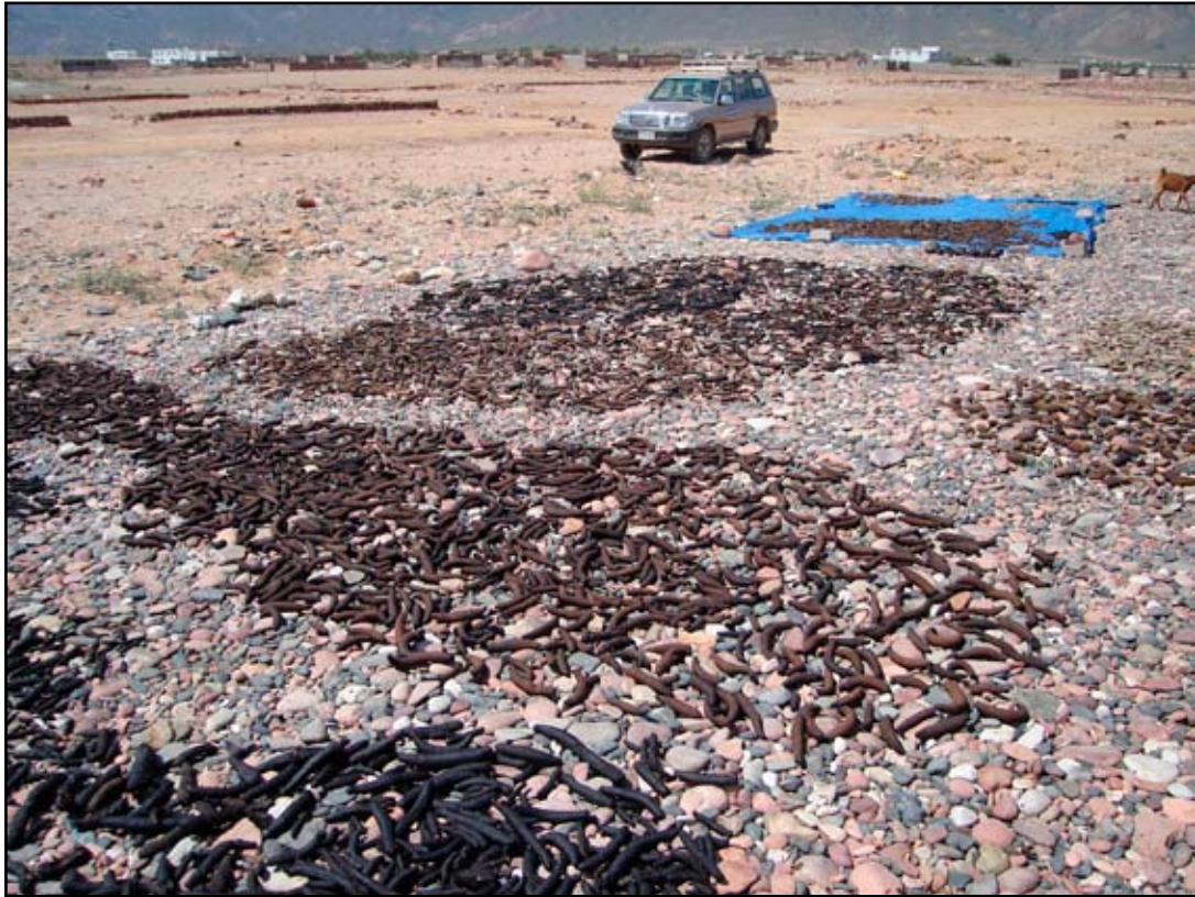
الصورة (5): خيار بحر معالج في جزيرة سقطرى في 2006.

يحظى أرخبيل سقطرى بخط ساحلي ممتد يشمل الجزر البعيدة عن الشاطئ، وأنظمة الشعاب ولديه مناطق كبيرة من المواطن الأحيائية الملائمة لخيار البحر. وقد ظل يدعم مصائد خيار البحر ذات العائد المربح في العديد من السنوات الماضية. وظلت عمليات جمع خيار البحر في الأرخبيل تمارس منذ سنوات عديدة، وإن كانت بمستوى أقل، وذلك استجابةً لطلبات التجار من الخارج. ومؤخراً تطورت الصناعة (أنظر الصورة 5) لا سيما وأن مخزون خيار البحر في اليمن والبلدان المجاورة قد تم استنزافه وأخذ التجار ينقلون أعمالهم إلى المناطق التي لا يزال بها مخزون.