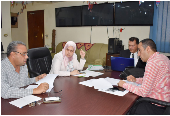
المشاركون في الاجتماع بوزارة البيئة بالقاهرة