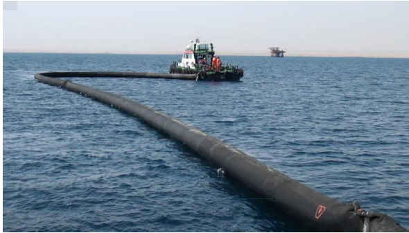
التدريب بالبحر على استخدام معدات المكافحة

لذلك قامت إحدى شركات البترول بالتعاون مع شركائها في مجال مكافحة التلوث البحري، بتنفيذ التدريبات التعاونية التي تمكن من تقليل الوقت المطلوب لمكافحة التلوث البحري وأيضاً التدريب على تنفيذ الإجراءات التي يجب أن تتبع لكي تكون إجراءات المكافحة أكثر سهولة عند تنفيذها.