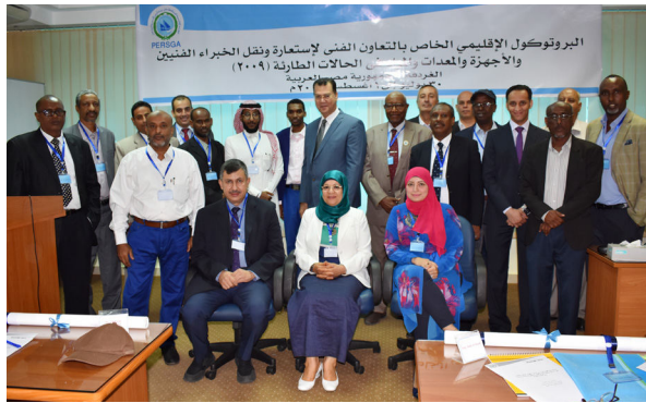
المشاركون في ورشة العمل الإقليمية حول البروتوكول الإقليمي الخاص بالتعاون الفني لاستعادة ونقل الخبراء الفنيين والأجهزة والمعدات والمواد في الحالات الطارئة (2009)

قامت الهيئة الإقليمية للمحافظة على بيئة البحر الأحمر وخليج عدن بعقد ورشة عمل إقليمية حول البروتوكول الإقليمي الخاص بالتعاون الفني لاستعادة ونقل الخبراء الفنيين والأجهزة والمعدات والمواد في الحالات الطارئة (2009) وذلك بمركز المساعدات المتبادلة للطوارئ البحرية PERSGA/EMARSGA في مدينة الفردقة خلال الفترة من 30 يوليو إلى 1 أغسطس 2018 م. وشارك في إعطاء مواد هذه الورشة كل من سعادة الدكتور منسق مكون (التلوث البحري) من (الهيئة الإقليمية للمحافظة على بيئة البحر الأحمر وخليج عدن PERSGA) وسعادة الدكتور مدير المركز.