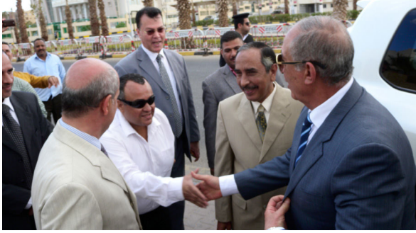
استقبال السيد اللواء أ.ح/ أحمد عبد الله (محافظ البحر الأحمر) أثناء الاحتفال بيوم محافظة البحر الأحمر.

2- مشاركة الهيئة من خلال المركز في الاحتفال بيوم محافظة البحر الأحمر - بالغردقة - جمهورية مصر العربية، يوم الخميس الموافق 25 يناير 2018م.