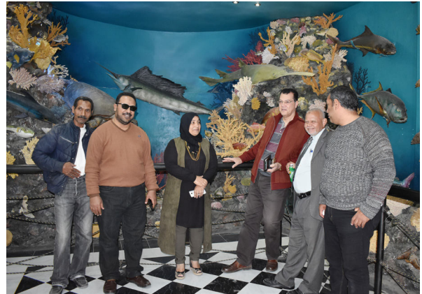
تطوير متحف الأحياء المائية بفرع المعهد بالغردقة

5- متابعة مركز المساعدات المتبادلة للتطوير البحرية / PERSGA / EMARSA لتطوير المعهد القومي لعلوم البحار والمصايد بالغردقة يوم 20 فبراير 2018م.