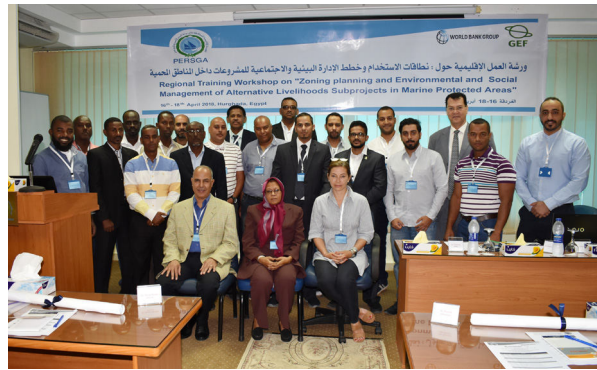
المشاركون في ورشة العمل الإقليمية حول نطاقات الاستخدام وخطط الإدارة البيئية والاجتماعية للمشروعات داخل المناطق المحمية.

قدم السادة خبراء الهيئة محاضرات حول أهمية مشاركة المتخصصين من دول الإقليم في هذه الورشة، لزيادة تشاورهم في موضوع الورشة،