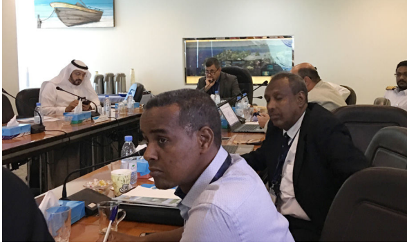
المشاركون في ورشة العمل الإقليمية حول «اتفاقية ماربول / رقابة دولة الميناء»

سنة (6) ملحقات تتعلق بالزيوت والمواد الكيماوية والضارة ومخلفات المواد السائلة (قاذورات مجارير السفن) والنفايات الصلبة (قمامة السفن) وتلوث الهواء (ضبط الانبعاثات الغازية من السفن)