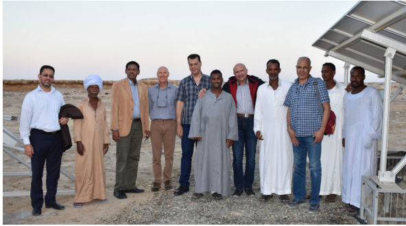
المشاركون في زيارة محمية وادي الجمال

تم تفقد اللجنة المكونة من عدد من خبراء الهيئة برفقة الخبير الدول الدكتور/ توني منطقة القلعان جنوب وادي الجمال - محمية وادي الجمال بحماطة - محمية أم العيس وكذلك قرية أبو غصون.