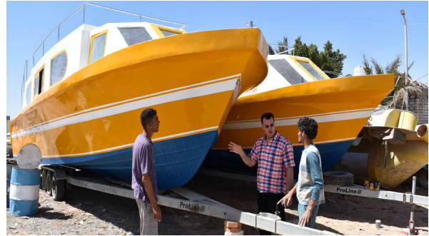
متابعة لنشات القاع الزجاجي لمصر قبل التسليم يوم 19 مارس 2018م