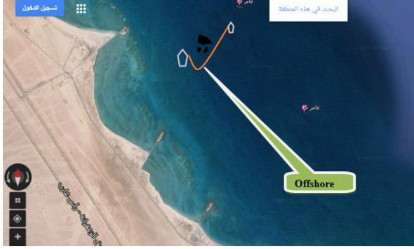
خريطة توضح موقع التدريب بالبحر

للعاملين في مجال مكافحة أفضل وسائل التواصل والفهم للقدرات الجماعية على مكافحة التلوث البحري بالبتترول.