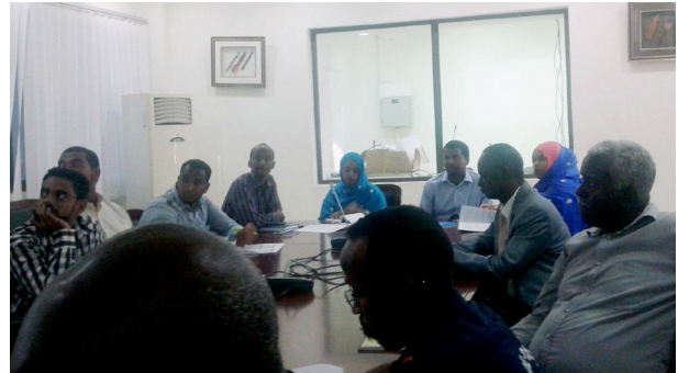
المشاركون في ختام فاعليات ورشة العمل الوطنية الخاصة بالاستراتيجية الوطنية لإدارة مياه توازن السفن ٢٦ أبريل ٢٠١٨م

(1) يوم 26 أبريل 2018م تم حضور ختام ورشة العمل الوطنية في جيبوتي الخاصة بالتحقق من صحة الاستراتيجية الوطنية لإدارة مياه الصابورة والرواسب من السفن