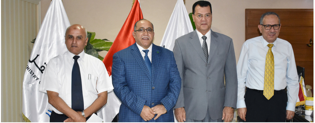
اجتماع مع قيادات هيئة موانئ البحر الأحمر بالسويس يوم ٠٤ يونيو ٢٠١٨ م