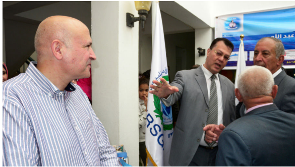
تفقد السيد المحافظ مطبوعات الهيئة الإقليمية للمحافظة على بيئة البحر الأحمر وخليج عدن.

شاركت الهيئة الإقليمية للمحافظة على بيئة البحر الأحمر وخليج عدن، من خلال مركز المساعدات المتبادلة للتوارئ البحرية / PERSGA EMARSGA محافظة البحر الأحمر من خلال الإدارة العامة للشؤون البيئية ووزارة البيئة من خلال الفرع الإقليمي لجهاز شؤون البيئة بالبحر الأحمر بجمهورية مصر العربية، يوم الخميس الموافق 25 يناير 2018م ختام فاعلات الاحتفال بيوم محافظة البحر الأحمر لعام 2018م، والذي عقد بقصر الثقافة بالغردقة - جمهورية مصر العربية.