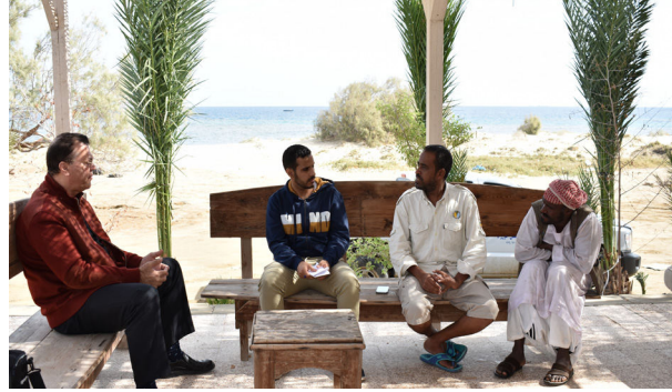
اجتماع مع إدارة محمية وادي الجمال

كما عزز من كفاءة شبكة المناطق البحرية المحمية في دول الإقليم، كما حسن إدارة مصائد الأسماك ودعم المشاركة الإيجابية للمجتمع في