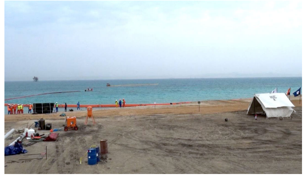
التدريب على أعمال المكافحة البرية