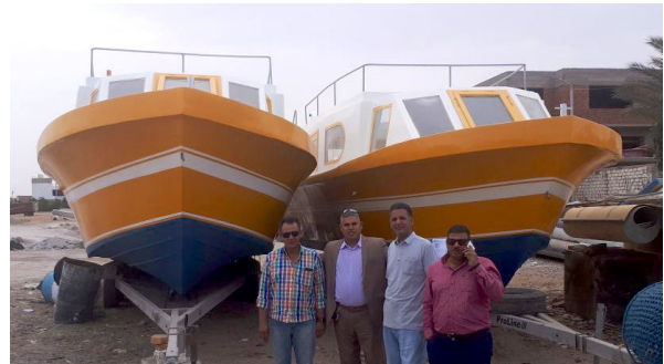
لجنة محميات البحر الأحمر أثناء استلام نشات القاع الزجاجي لمصر يوم 27 مارس 2018م

2- مشاركة المركز في اجتماع مشروع استراتيجية الإدارة بتنوع النظام البيئي في البحر الأحمر وخليج عدن (SEM)، بعثة دعم التنفيذ من البنك الدولي، المنعقدة في الهيئة الإقليمية للمحافظة علي بيئة البحر الأحمر وخليج عدن، بجدة، المملكة العربية السعودية، خلال الفترة من الثلاثاء الموافق 16 إلى الخميس 18 أكتوبر 2018 م