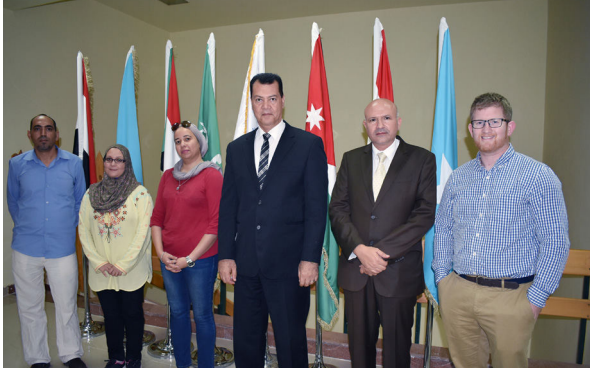
المشاركون في التدريب على منظومة التسرب النفطي (Oil Map).

وتهدف هذه المنظومة الى توفير الدعم لمتخذ القرار أثناء التصدي للحالات الطارئة الناتجة عن انتشار الزيت في البيئة البحرية. ويتم هذا عن طريق توقع مسار انتشار هذا الزيت والكميات التي ستصل منه إلى الشاطئ وتقوم المنظومة بتحديد مدى التأثير من خلال عملها كحاكي للبيئة الواقعية ويتم عرض هذه المخرجات على هيئة خرائط بسرعة كبيرة لتقديمها لمتخذ القرار أثناء إدارة الازمة. الأمر الذي يساعد متخذ القرار على توجيه الموارد المخصصة للمكافحة والتصدي للتلوث الى الأماكن الأكثر حساسية بيئية بما يترتب عليه أثراً مباشراً في الحد من التأثير السلبي للتلوث.