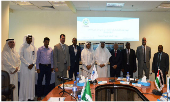
اجتماع السادة نقاط الاتصال للهيئة الإقليمية يوم الثلاثاء 13 مارس 2018م.

تم عقد اجتماع نقاط الاتصال الوطنية لمتابعة سير العمل للعام 2017م بجدة- المملكة العربية السعودية يوم الثلاثاء 25 جمادى الآخرة 1439هـ الموافق 13 مارس 2018م، بحضور سعادة الأستاذ الدكتور/ زياد بن حمزة أبو غرارة أمين عام الهيئة الإقليمية للمحافظة على بيئة البحر الأحمر وخليج عدن PERSGA، وترأس الاجتماع عطفة السيد/ سليمان النجدات، مفوض شؤون البيئة والإقليم في سلطة منطقة العقبة الاقتصادية الخاصة، بالمملكة الأردنية الهاشمية، بصفة ترأس الأردن الدورة الحالية للمجلس الوزاري للهيئة الإقليمية للمحافظة على بيئة البحر الأحمر وخليج عدن PERSGA.