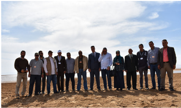
أعضاء الفريق البحثي أثناء الرحلة الاستكشافية برأس جمشة شمال البحر الأحمر.

عقدت الهيئة الإقليمية للمحافظة على بيئة البحر الأحمر وخليج عدن (PERSGA) ورشة عمل مشروع على أرض الواقع (الاجتماع التنسيقي لمشروع -إدارة الشريط الساحلي للمنطقة الواقعة بين شمال الغردقة ورأس غارب بالبحر الأحمر - جمهورية مصر العربية)، واستمرت الورشة لمدة يومين وذلك أيام السبت والأحد الموافق 10 و11 فبراير 2018م، في مركز المساعدات المتبادلة للطوارئ البحرية، PERSGA/ EMARSGA.