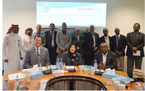
اجتماع لجنة التوعية الإقليمية للمشروع يوم 14 مارس 2018م.