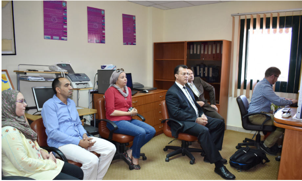
التدريب على منظومة التسرب النفطي « OIL MAP »، بغرفة العمليات بالمركز

وتهدف هذه المنظومة الى توفير الدعم لمتخذ القرار أثناء التصدي للحالات الطارئة الناتجة عن انتشار الزيت في البيئة البحرية. ويتم هذا عن طريق توقع مسار انتشار هذا الزيت والكميات التي ستصل منه إلى الشاطئ وتقوم المنظومة بتحديد مدى التأثير من خلال عملها كحاكي للبيئة الواقعية ويتم عرض هذه المخرجات على هيئة خرائط بسرعة كبيرة لتقديمها لمتخذ القرار أثناء إدارة الازمة. الأمر الذي يساعد متخذ القرار على توجيه الموارد المخصصة للمكافحة والتصدي للتلوث الى الأماكن الأكثر حساسية بيئية بما يترتب عليه أثراً مباشراً في الحد من التأثير السلبي للتلوث.