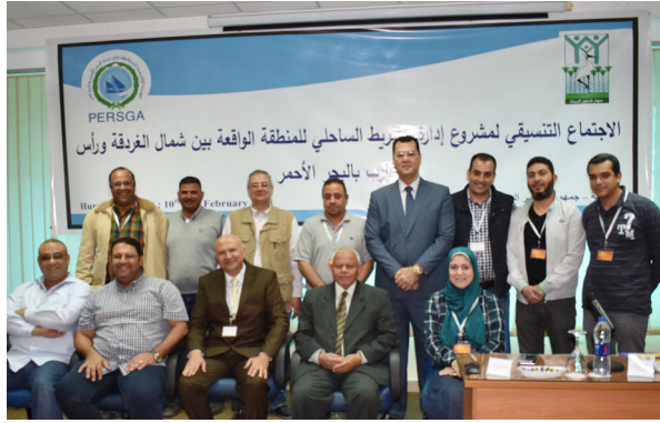
المشاركون في الاجتماع التنسيقي لمشروع (إدارة الشريط الساحلي للمنطقة الواقعة بين شمال الغردقة ورأس غارب بالبحر الأحمر)

4- الاجتماع التنسيقي لمشروع (إدارة الشريط الساحلي للمنطقة الواقعة بين شمال الغردقة ورأس غارب بالبحر الأحمر - جمهورية مصر العربية)، السبت الموافق 10 فبراير 2018م.