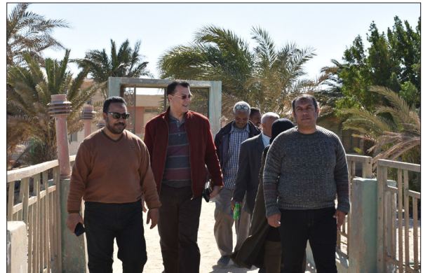
تفقد منطقة الأحواض الخارجية التي ينوي المعهد تطويرها