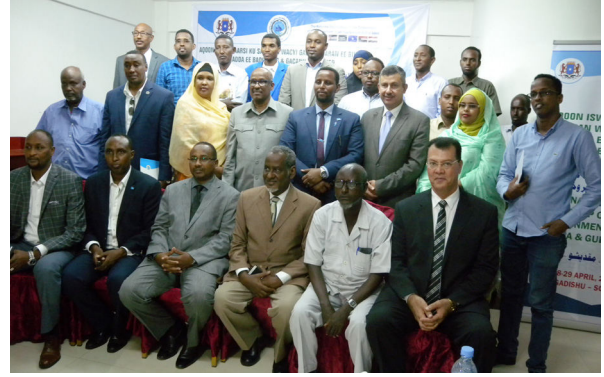
المشاركون في الورشة الوطنية التوعوية حول البيئات البحرية في البحر الأحمر وخليج عدن بمجمهورية الصومال الفدرالية.