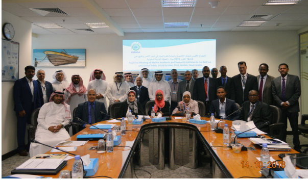
الاجتماع الإقليمي للمعاهد الأكاديمية والبحثية لعلوم البحار في البحر الأحمر وخليج عدن (RSGA SOMER II)

نفذت PERSGA أول تقرير للبيئة البحرية في البحر الأحمر وخليج عدن بعد الانتهاء من برنامج العمل الاستراتيجي في عام 2006، وقد اعتمد التقييم المتكامل بشكل أساسي على المسوحات والمراجعات وأعمال التقييم التي نفذت من خلال مشروع SAP في أواخر التسعينات/ أوائل 2000م، والأعمال الأخرى ذات الصلة في المنطقة حتى ذلك الحين، تم التخطيط لها من قبل PERSGA، وقد كانت هذه هي الخطوة الأولى التي يتم تعزيزها واستدامتها كعملية منتظمة للتقييم المتكامل للبيئة البحرية في منطقة RSGA .