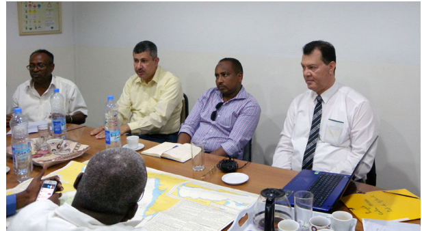
اجتماع مجموعة عمل بيرسجا في ميناء جيبوتي مع المسؤولين في الميناء ووزارة الإسكان والتعمير والبيئة يوم ٢٦ إبريل ٢٠١٨م.

(2) اجتماع مجموعة عمل بيرسجا مع المسؤولين في ميناء جيبوتي ووزارة الإسكان والتعمير والبيئة بميناء جيبوتي يوم 26 إبريل 2018م حيث عقد الاجتماع في ميناء جيبوتي.