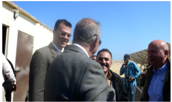
السيد المحافظ أثناء تقديم الشكر لمجموعة عمل الهيئة لما تقدمه PERSGA للمحافظة وذلك أمام ألواح الطاقة الشمسية بالقلعان.

وجه السيد المحافظ الشكر والتقدير، للهيئة الإقليمية للمحافظة على بيئة البحر الأحمر وخليج عدن PERSGA وسعادة أمين عام الهيئة الأستاذ الدكتور/ زياد بن حمزة أبو غرارة على التمويل المادي والفني لمشغل فتيات أبو غصون للأعمال اليدوية بقرية أبو غصون، ومحطة كهرباء الطاقة الشمسية بالقلعان جنوب مرسى علم، وذلك أثناء افتتاح اللواء أحمد عبد الله، محافظ البحر الأحمر، يوم الأربعاء الموافق 31 يناير 2018م، مشغل فتيات أبو غصون للأعمال اليدوية بقرية أبو غصون، ومحطة كهرباء الطاقة الشمسية بالقلعان، جنوب مرسى علم، وتفقد المحافظ محتويات المشغل والمعرض المصاحب له والخاص بمنتجات المشغل، معرباً عن إعجابه الشديد بالمشغولات اليدوية المعروضة، مشيراً إلى أهمية ترويج تلك المشغولات والمنتجات مما يساهم في زيادة فرص العمل لأهالي المنطقة.