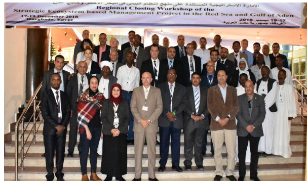
المشاركون في الورشة الإقليمية الختامية للمشروع

5- مشاركة المركز في الورشة الإقليمية الختامية لمشروع الإدارة الاستراتيجية المستندة على نهج النظام البيئي في البحر الأحمر وخليج عدن، المنعقدة في فندق سي جل، بالغردقة، جمهورية مصر العربية، خلال الفترة من الأثنين الموافق 17 إلى الأربعاء 19 ديسمبر 2018