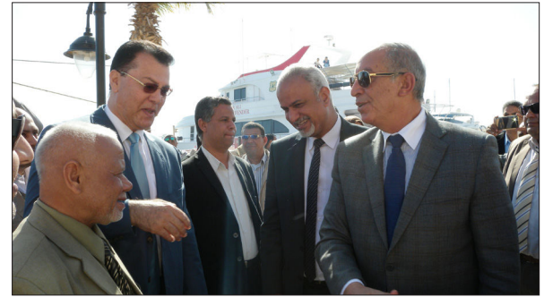
محافظ البحر الأحمر ورئيس جهاز شؤون البيئة ومدير المركز أثناء الاحتفال بتدشين مراكب المحميات بالغردقة - جمهورية مصر العربية يوم ٢٢ يناير ٢٠١٨م

تم الاحتفال بتدشين المراكب الجديدة المنضمة للإدارة العامة لمحميات البحر الأحمر بالمارينا السياحية بالغردقة - جمهورية مصر العربية، في حضور السيد اللواء/ أحمد عبد الله - محافظ البحر الأحمر، والسيد/ محمد شهاب الدين الرئيس التنفيذي لجهاز شؤون البيئة.