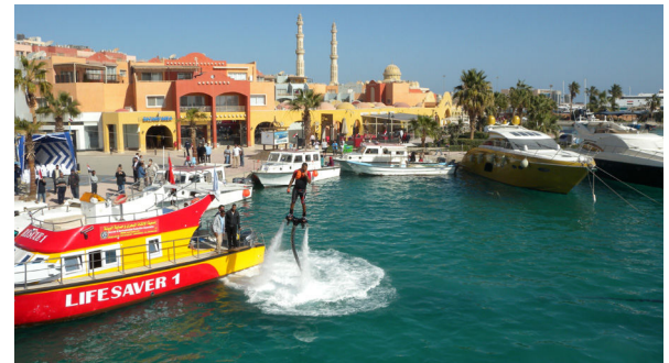
المراكب الخاصة بالإدارة العامة للمحميات

حيث نظم الاحتفال الإدارة العامة للمحميات بالتنسيق مع محافظة البحر الأحمر والفرع الإقليمي لجهاز شؤون البيئة بالبحر الأحمر ومشاركة الهيئة الإقليمية للمحافظة على بيئة البحر الأحمر وخليج عدن (مركز المساعدات المتبادلة للتوارئ البحرية بالبحر الأحمر وخليج عدن PERSGA/ EMARSGA) وذلك يوم الأربعاء الموافق 22 يناير 2018م، جاء ذلك تحت رعاية معالي الدكتور/ خالد فهمي وزير البيئة.