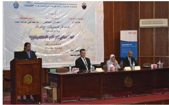
افتتاح ورشة العمل الخاصة بالبيئة البحرية بالبحر الأحمر (المشكلات والحلول)