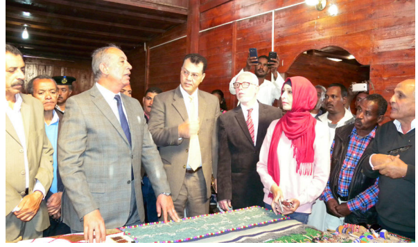
اللواء أحمد عبد الله، محافظ البحر الأحمر، أثناء افتتاح مشغل فتيات أبو غصون للأعمال اليدوية بقرية أبو غصون يوم الأربعاء الموافق 31 يناير 2018م.

3- افتتاح مشغل فتيات أبو غصون للأعمال اليدوية بقرية أبو غصون، ومحطة كهرباء الطاقة الشمسية بالقلعان، جنوب مرسى علم يوم الأربعاء الموافق 31 يناير 2018م.