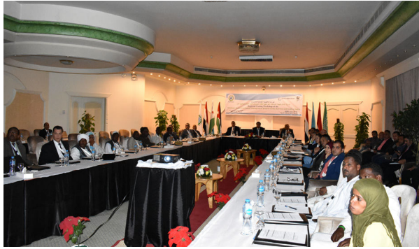
الترحيب بالسادة المشاركين بالورشوة من سعادة الأمين العام للهيئة الإقليمية الأستاذ الدكتور/ زياد بن حمزة ابو غرارة

الحفاظ على الموارد من خلال تنفيذ المشاريع على الأرض، مبدأ الإدارة القائمة على النظام الإيكولوجي «EBM» أن المشروع يعتمد عدداً من الأدوات، وهي تحسين أدوار المناطق البحرية المحمية في الحفاظ على موائل الكائنات والتوازن الغذائي لأنواع الأسماك المهمة، مما يعزز التنوع البيولوجي، ومع ذلك فإن EBM يعزز إدارة المناطق البحرية المحمية فائدة المجتمعات المحلية من خلال نهج قائم على الحوافز للإدارة المستدامة للموارد الساحلية والبحرية، تبني EBM أيضاً على المراقبة الاجتماعية والبيئية لتقييم آثار الإدارة وتنوير صناعات القرار والجمهور من تدابير الإدارة الودية التي يجب اتباعها.