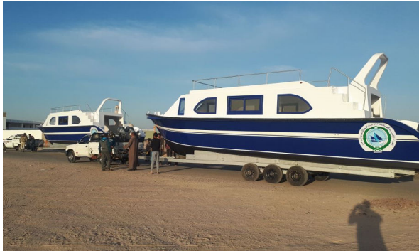
مراكب القاع الزجاجي للسودان (٢ مركب) ولنش سريع فايبر جلاس أثناء سفرهم للسودان

قدم السيد الدكتور مدير المركز كلمة ترحيبية بالسادة الحضور نقل فيها تحيات سعادة أمين عام الهيئة، وأمنيته بالتوفيق بأن تكفل مجهودات السادة المشاركين بالنجاح ويتحقق الأهداف المرجوة من ورشة العمل، وتم تقديم شرح عن دور المركز في الحفاظ على البيئة بالبحر الأحمر وخليج عدن.