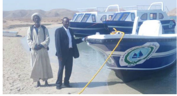
مراكب القاع الزجاجي للسودان (2مركب) ولنش سريع فايبر جلاس بعد تسليمهم للسلطات المختصة في السودان

تم تفقد اللجنة المكونة من عدد من خبراء الهيئة لأنشطة المشروع بمنطقة جنوب وادي الجمال - محمية وادي الجمال بحماطة - قرية أم العيس - وقرية القلعان - وقرية أبوغصون، حيث تم تسليم المعدات لإدارة العامة للمحميات بالبحر الأحمر بالغردقة وتم تسليم محطة الكهرباء بالطاقة الشمسية بقرية القلعان جنوب مرسى علم ومحطة تحلية المياه بالطاقة الشمسية بقرية القلعان جنوب مرسى علم ومحطة الكهرباء بالطاقة الشمسية بمبنى محمية أم العيس بوادي الجمال، ومشغل فتايات أبو غصون للمستفيدين من المحميات والمجتمع المحلي جنوب محافظة البحر الأحمر، بجمهورية مصر العربية.