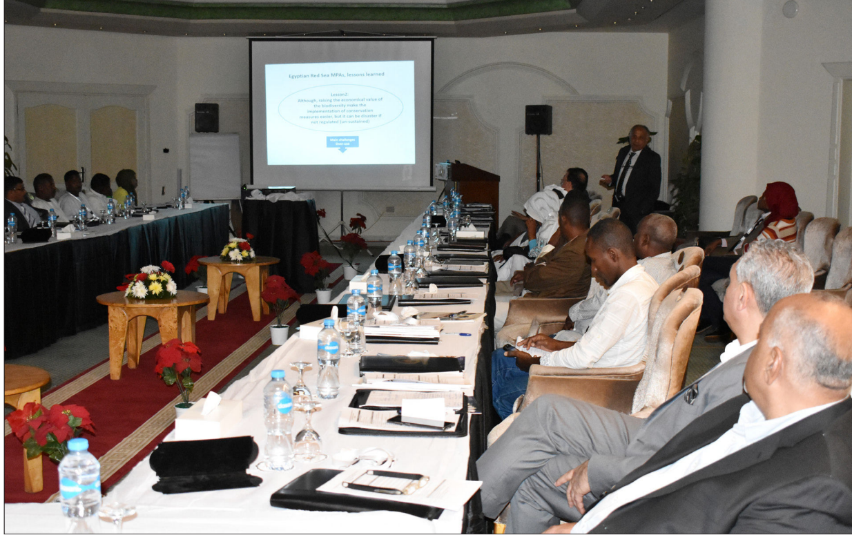
عرض المنسقين الوطنيين للدول لأنشطة المشروع

د- كيفية الاستفادة من تطوير التدريب ومراجعة الاستراتيجيات واللوائح وبرامج العمل وذلك لدعم التنمية الساحلية والبحرية في موانئ البحر الأحمر. هـ- تحديد المشكلات والقضايا التي تواجه العاملين في مجال الحفاظ على البيئة البحرية في البحر الأحمر.