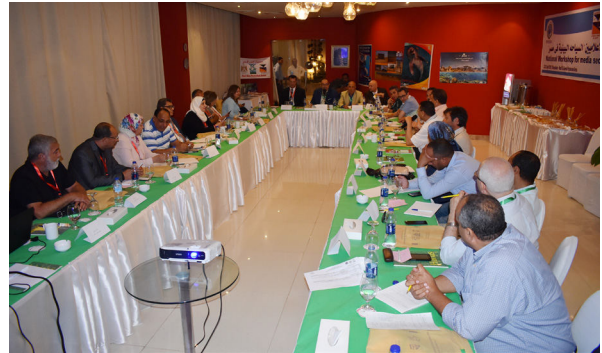
المشاركون في ورشة العمل الوطنية للساده الإعلاميين، السياحة البيئية في مصر